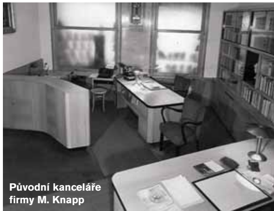
Původní kanceláře firmy M. Knapp