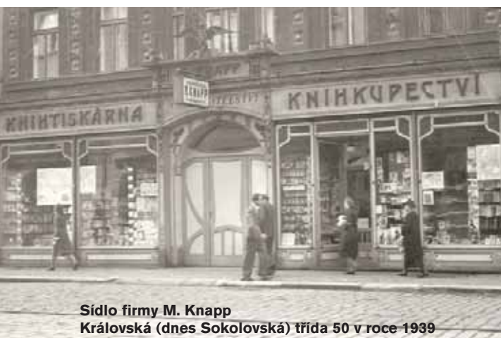
Sídlo firmy M. Knapp Královská (dnes Sokolovská) třída 50 v roce 1939