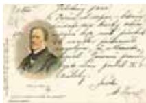
Ukázky z korespondence s tehdejšími spolupracujícími autory