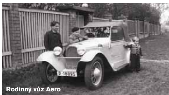
Rodinný vůz Aero